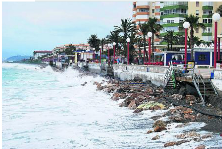
Gute Wasserqualität, doch der Ferrara-Strand hat wieder keinen Sand. :: SUR

Um die Strandpromenade ist es nicht besser bestellt, seit Februar ist kein Strand mehr da. Da ist es auch kein Trost für die Tourismus-Stadträtin, wenn ihr das Gesundheitsministerium bescheinigt, dass die Torroxer Strände eine exzellente Wasserqualität aufweisen. An den Tagen, an denen der Wind günstig steht und keine Abwässer aus Nerja nach Torrox treibt. Nerja soll ja jetzt bald eine Kläranlage bekommen. Die Betonung liegt auf den Worten 'soll' und 'bald'. Wirksame Beruhigungsspillen der andalusischen Landesregierung für ungeduldige Bürgermeister.