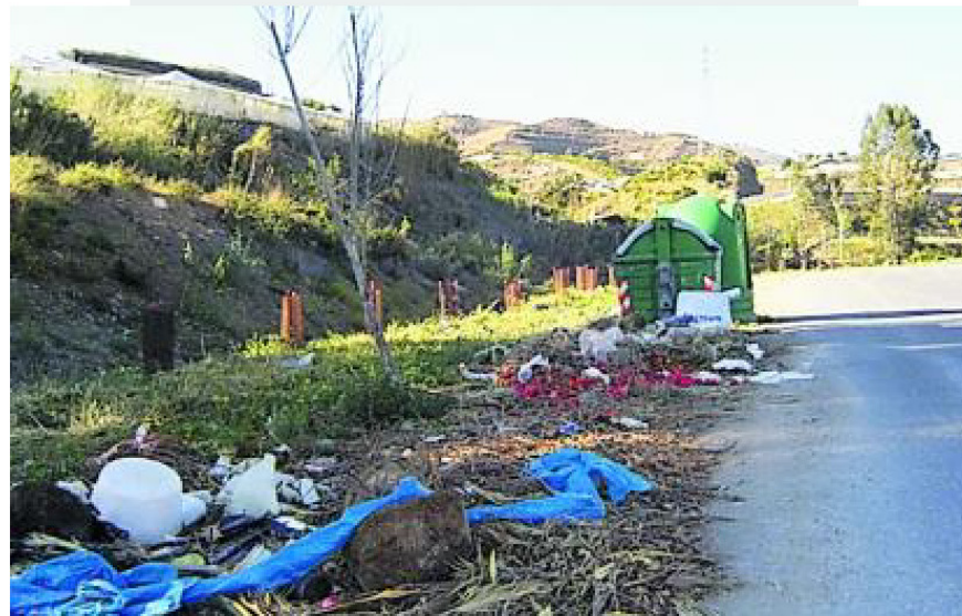
Kein würdiger Rahmen – Müll am Friedhofsweg von El Morche.

Inzwischen wurde der Versuch gemacht, die vertrockneten Bäume entlang des Río Manzano neben diesem Weg durch eine Neupflanzung zu ersetzen. Es wurden Miniaturpflanzen verwendet, die aber tapfer ums Überleben kämpfen. Zu ihrem Schutz wurden diese Frühchen mit einer Gitterhülle umgeben und mit Metallstäben gesichert. Ein großer Teil dieser Schutzhüllen wurde inzwischen gestohlen. Nun stehen die kleinen Bäumchen ungeschützt im hohen Unkraut. So viel Gleichgültigkeit nicht nur der Natur gegen-